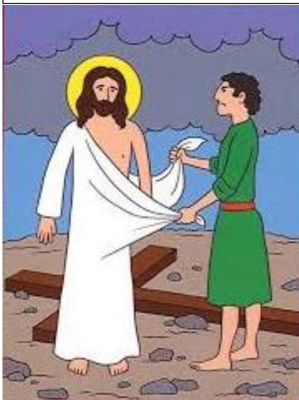
Pánu Ježišovi zvliekajú šaty