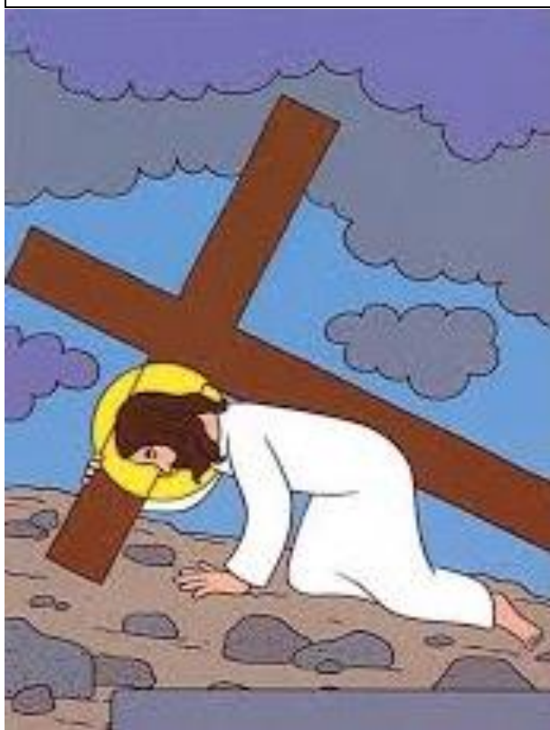
Pán Ježiš padá tretí raz pod krížom