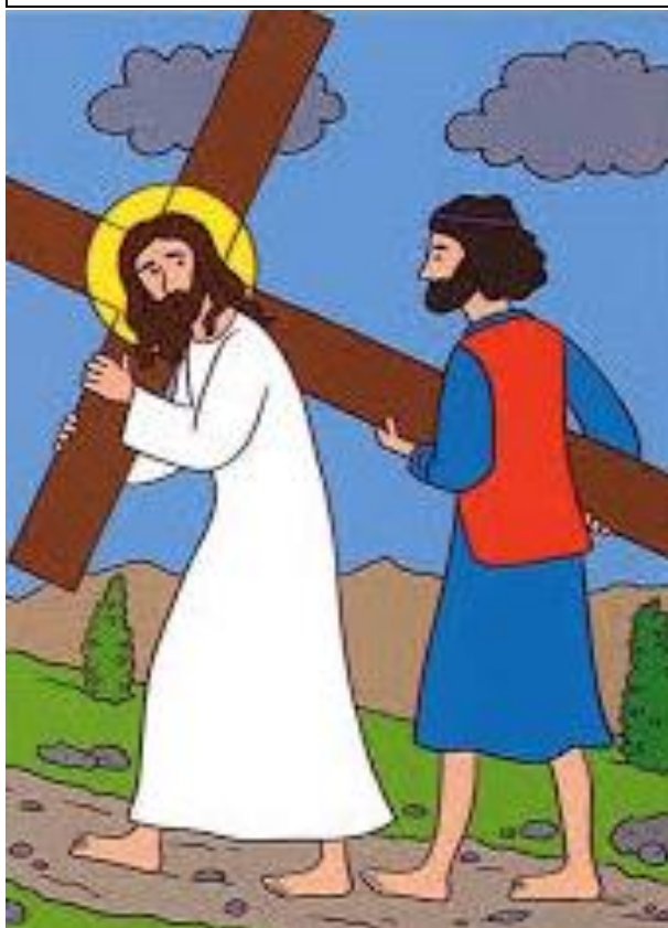
Šimon Cyrenejský pomáha Pánu Ježišovi niesť kríž