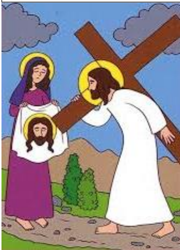
Veronika podáva Pánu Ježišovi šatku