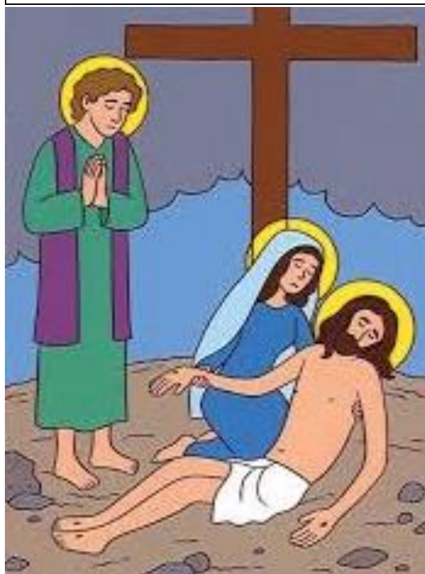
Pána Ježiša pochovávajú