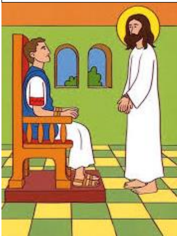
Pán Ježiš je odsúdený na smrť